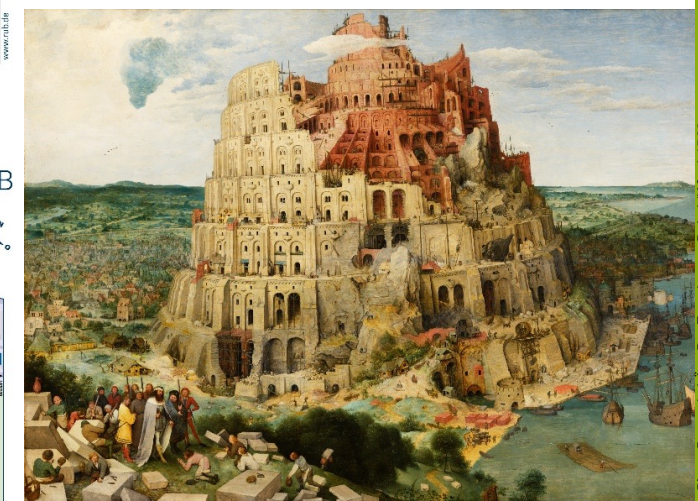
Pieter Breugel d.A., - Der Turmbau zu Babel (Wien) 1563

Methoden und Techniken der Schriftauslegung im Spannungsfeld von Laien- und Expertenkultur